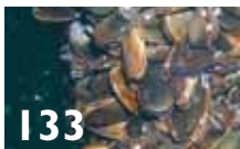
133 Er oppdrett av blåskjell miljøvennlig?