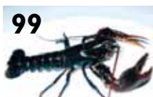
Hummer – respekteres nye regler?