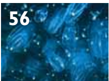
Lobemaneten – en tilpasningsdyktig innvandrer