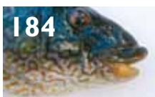
184 Berggylte som lusekontrollør