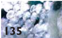
135 Rekordhøy lakseeksport i 2008