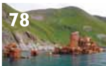
Vrak – en miljøtrussel