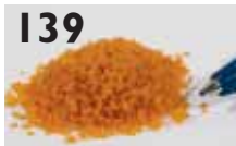
139 Kan laksen bli vegetarianer?