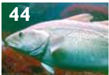
Kysttorsk og skrei