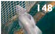
148 Kan rett not hindre rømming av torsk?