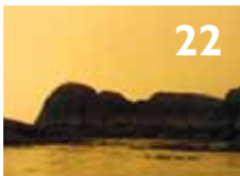
Kystklima i endring