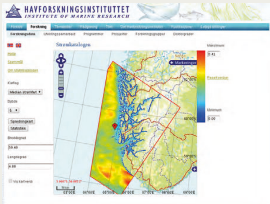
Figur 1. Strømkatalogens brukergrensesnitt. Området i den røde boksen dekkes av prototypen. Bildet viser gjennomsnittlig strømstyrke på fem meters dyp. Den røde markøren viser en valgt posisjon. Til venstre er det menyer for å velge hva som presenteres i kart, strømstatistikk fra enkeltposisjoner eller bestilling av spredningskart.

Brukergrensesnittet (figur 1) presenterer informasjon i form av kart som kan zoomes og panoreres. En kan velge posisjoner ved å klikke i kartet eller taste inn bredde- og