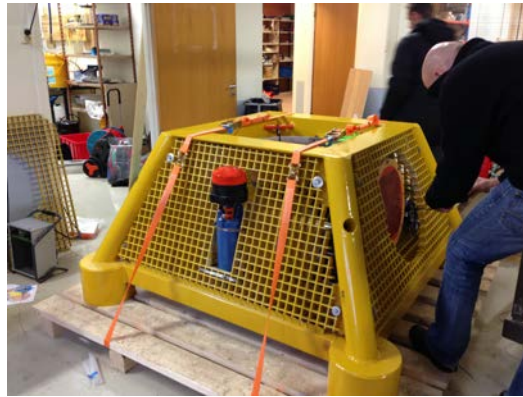
Figur 1: Instrumentplattform med påmontert utstyr.

Instrumentplattformen og utstyr brukt for utsetting av denne er utviklet av Metas og ble betjent av representanter for selskapet. Det er viktig å merke seg at strømforsyningen til instrumentene på plattformen kommer fra to batteribeholdere. Når man tar opp plattformen er det viktig at strømforsyningskabler blir koblet fra batteribeholderne så raskt som mulig for å unngå at ekkoloddene kjøres i luft.