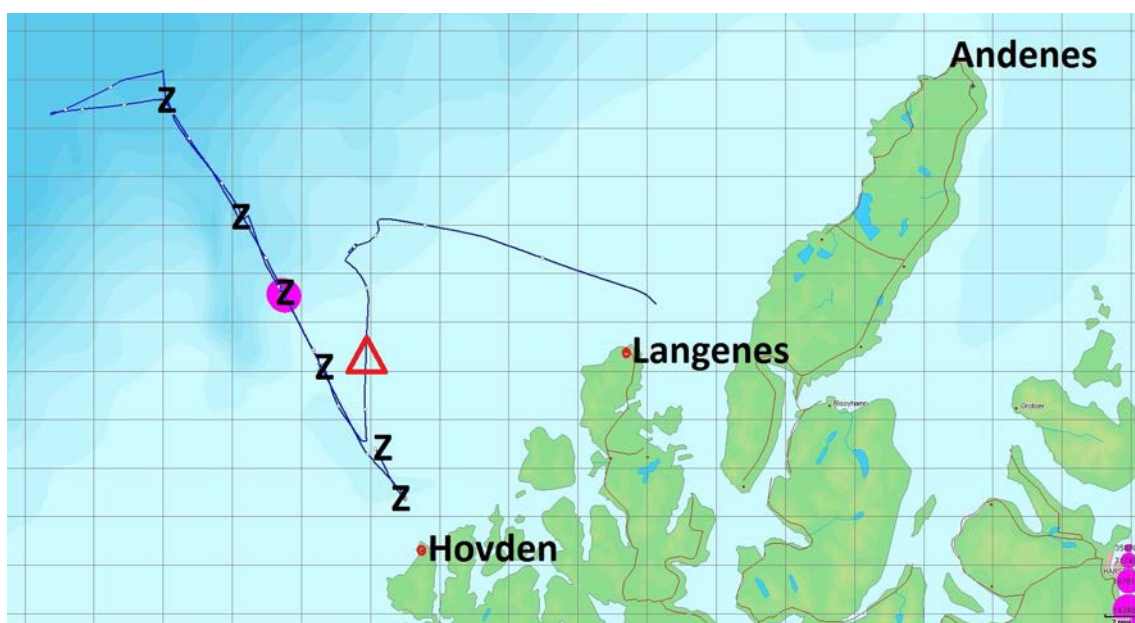
Figur 4: Kart som viser transekt/snitt. CTD-stasjoner er merket med Z og bunntrålstasjon er merket med rød trekant.

Etter utsetting av instrumentplattform ble det gjennomført et transekt/snitt som vist i figuren nedenfor, der fartøyet sin egen instrumentering i form av ekkolodd ble brukt.