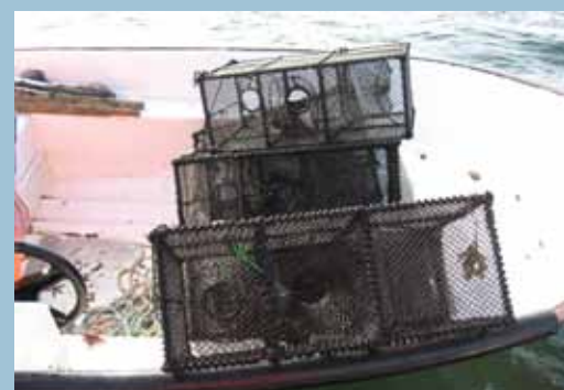
Figur 2: Teinene som ble brukt ble egnet med kokte reker.