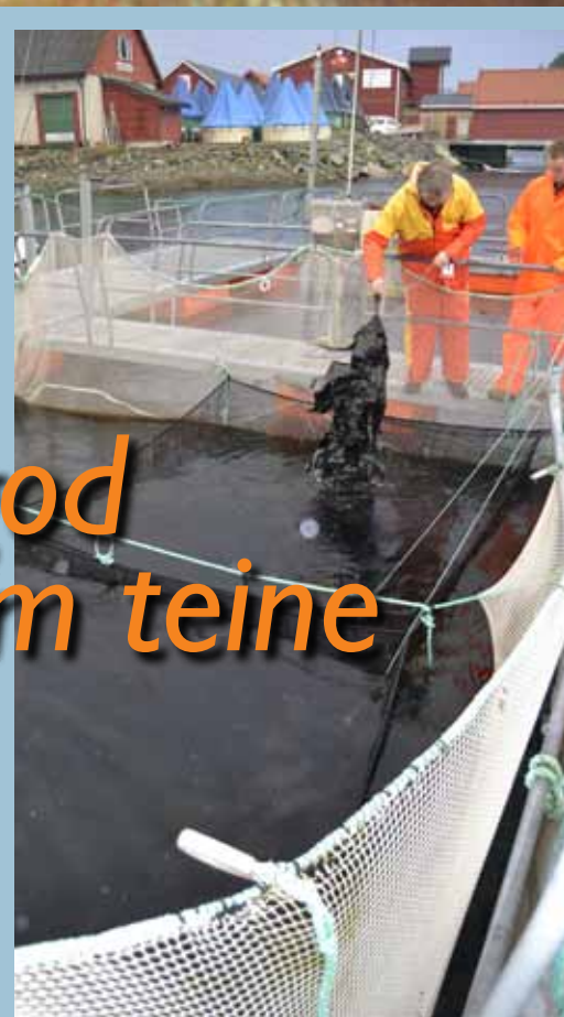
Figur 1: Rigging av notposene brukt i overlevelsesforsøkene. Bildet viser også tareskjulet som ble brukt.

Blant argumentene mot rusefisket er både egenskaper ved selve redskapet og at det ofte kreves lengre ståtid for ruser enn for teiner for å oppnå kommersielle fangster. Ved fiske med ruser benyttes som regel en ståtid på ett døgn, mens teiner