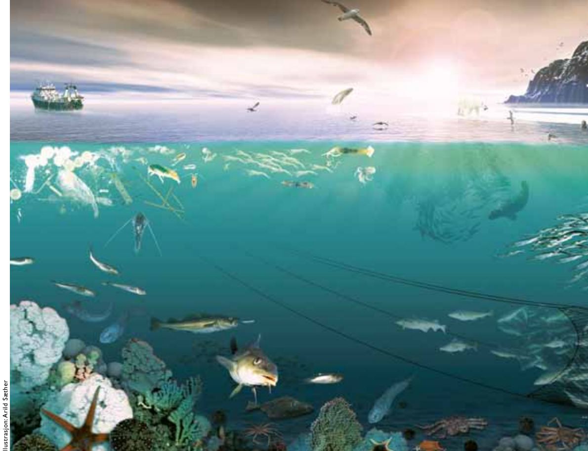
Illustrasjon: Arild Sæther