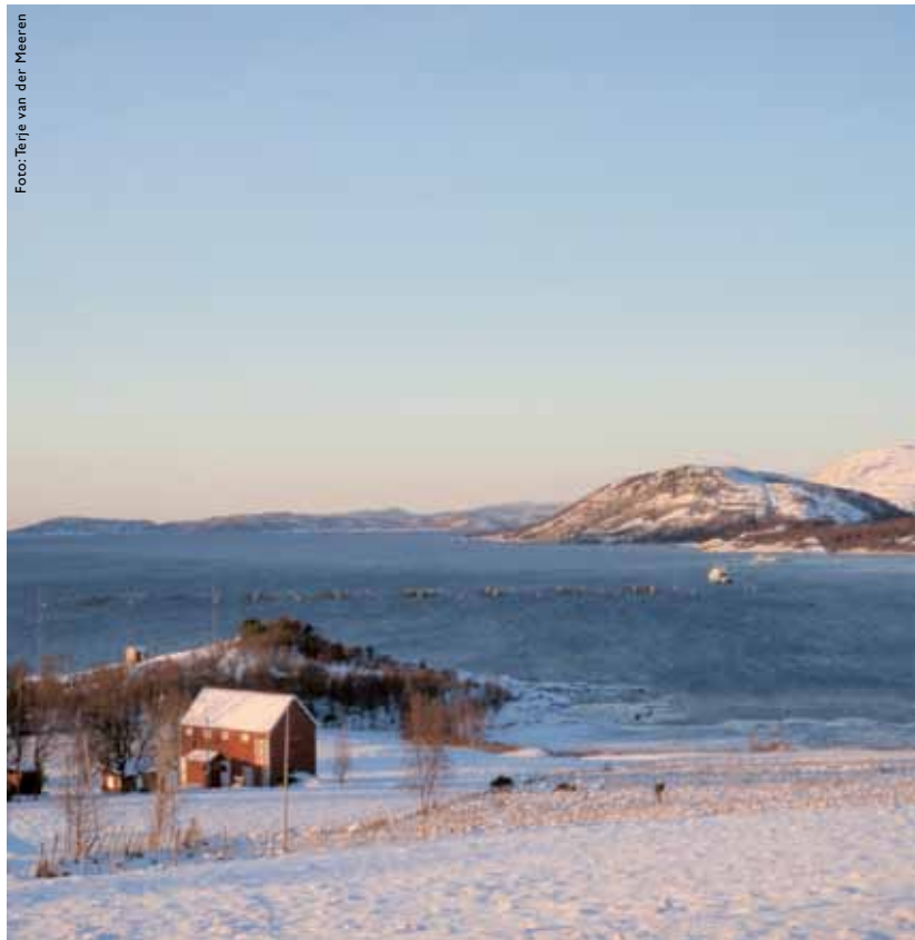
Skjerstadfjorden – et sentralt område i arbeidet med rømt oppdrettsorsk. Skjerstadfjorden – One of the study areas of effects of escaped Atlantic cod.

For å utvikle et miljøvennlig, kommersielt oppdrett av torsk, må det fremskaffes tilstrekkelig kunnskap om mulige negative miljøeffekter. Torsk skiller seg fra laks på to viktige områder: den er mye flinkere til å rømme, og kjønnsmoden fisk kan gyte i merdene før den når markedsstørrelse. I Heimarkspollen i Austevoll er det satt i gang et prosjekt med genetisk merket torsk for å undersøke gyting i merd. Her er det vist at torsk i merd produserer befruktede egg, og