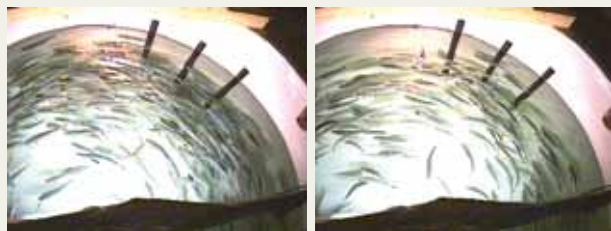
Figur 1. Venstre bilde: Normal atferd ved forventning av fôr under periode med lysblink før fôring hos postsmolt laks. Høyre bilde: Svak forventningsatferd etter temperaturfluktuasjon (+6 °C) over 4 timer (figur 2).

mål". Også svømmeatferd og fiskens fordeling i karene ble påvirket av stress, og kan benyttes som stressindikatorer. For eksempel valgte fisken å posisjonere seg i den høyest tilgjengelige styrken av vannstrøm ved høye temperaturer, det tyder på aktiv regulering av oksygenopptak (figur 3).