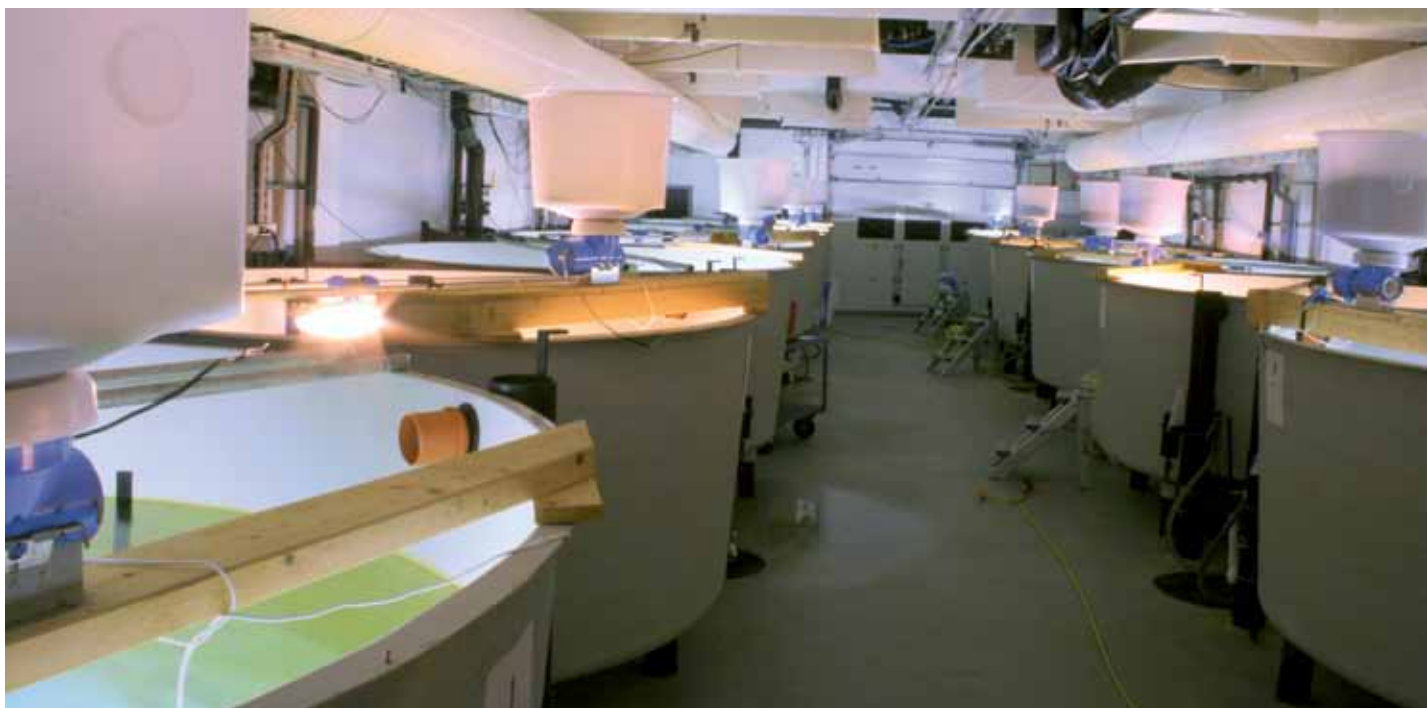
Figur 2. Miljøhallen på Forskningsstasjonen Matre. Experimental facilities for environmental studies at Matre Research Station.

På Matre holdes i dag villaks fra flere elver, oppdrettsfisk fra flere stammer og steril triploid laks. Med dette fiskematerialet gjennomføres studier for å finne ut hvilke endringer som har skjedd gjennom avlsarbeidet, og i modellstudier sammenligner vi hvilke biologiske konsekvenser dette har. Den sterile laksen kan bli et fremtidig alternativ i norsk oppdrettsnæring, og gjennom studier er vi i ferd med å finne ut hvordan denne fisken bør oppdrettes. En viktig del av disse studiene er å belyse de velferdsmessige konsekvensene for fisken, og å finne ut om den sterile fisken vil gi uforutsette og uønskede virkninger hvis den slipper ut i naturen.