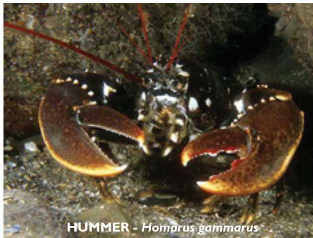
HUMMER - Homarus gammarus

Minstemålet på Vestlandet er økt til 25 cm fordi kjønnsmodningen inntreffer ved større lengde. Vårfisket har vist seg å beskatte de store hunnene i større grad enn høstfisket. Forbudet mot vårfiske som ble innført i 2002 vil forhåpentligvis på sikt gi et økt rekrutteringspotensial.