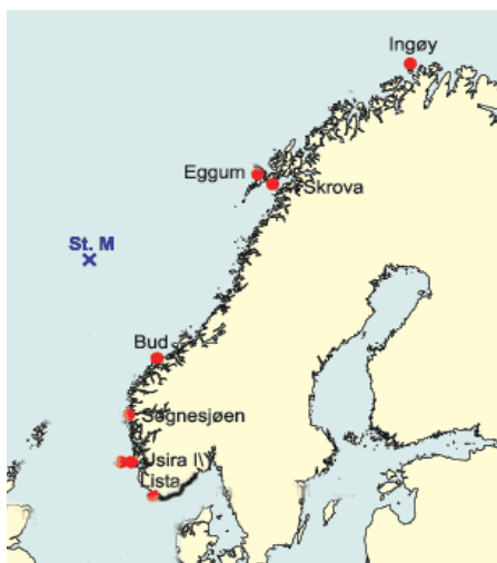
Fig 4. Geografisk plassering av HIs faste hydrografiske kyststasjoner. Stasjonene betjenes av lokale observatører som med jevne mellomrom besøker stasjonen der de utfører en vertikal STD (saltholdighet, temperatur, dyp) - profilmåling fra hele vannsøylen. Dataene logges i et registrerende instrument som siden overfører dataene til HI via modemforbindelse.

Figur 4 viser den geografiske plasseringen av HIs faste hydrografiske kyststasjoner. HI gjør også faste operasjonelle målinger av overflatetemperatur og overflatesaltholdighet fra Hurtigruten. Et stort antall faste målepunkt i norske fjorder besøkes en gang pr år. Ellers samler HI inn store datamengder fra hav, kyst og fjord fra egne forskningsfartøy.