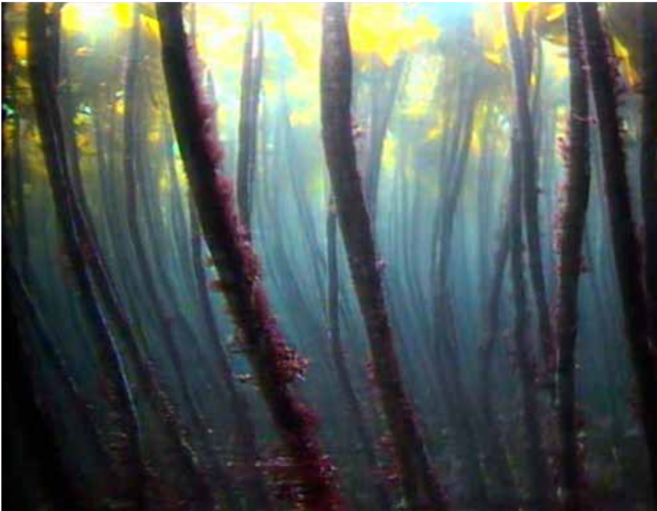
Figur 1.4.3 Frodig stortarevegetasjon utenfor Trøndelagskysten. A dense kelp-forest off the coast of Trøndelag, mid-Norway.