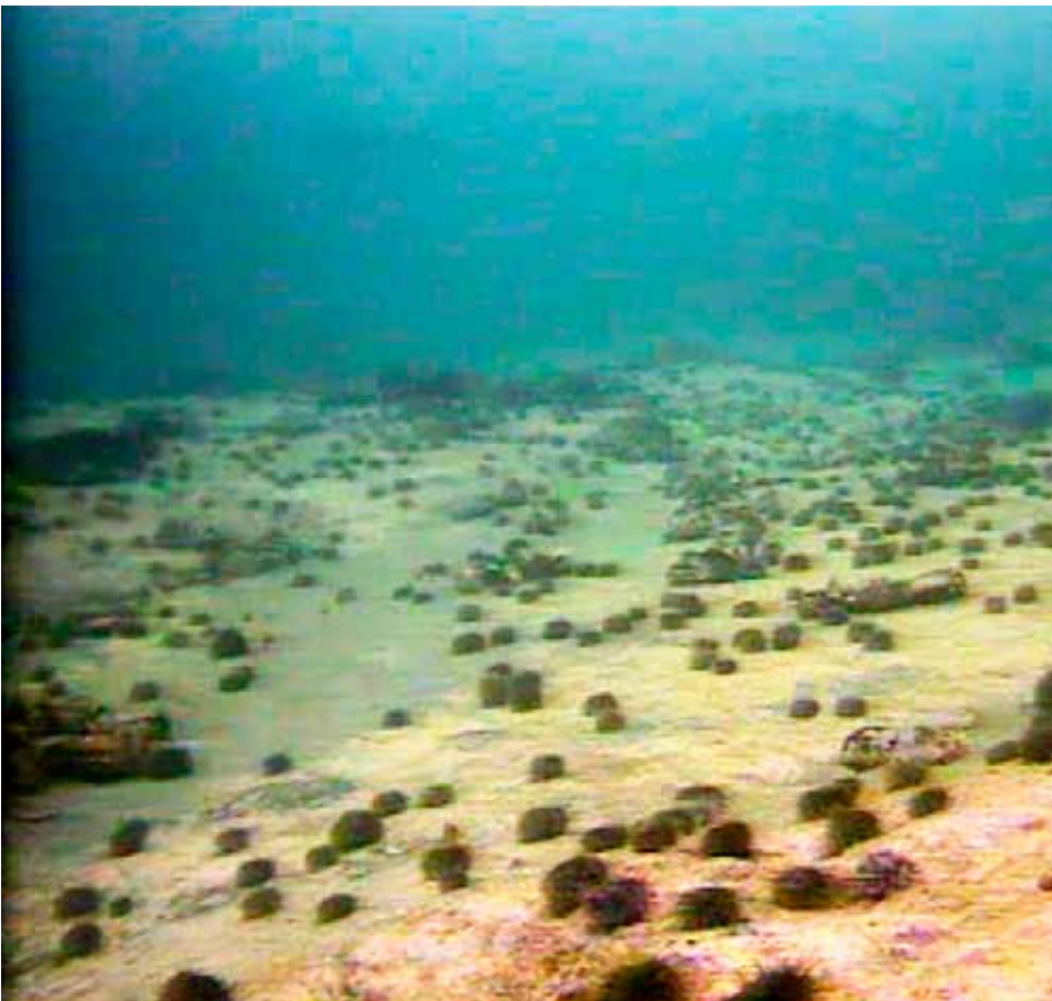
Figur 1.4.4 Langs kysten av Nord-Norge er deler av tareskogen nedbeitet av kråkeboller, som her utenfor kysten av Troms. Along the coast off Northern Norway a substantial portion of the kelp vegetation has been grazed down by sea urchins.

til et relativt lite antall lokaliteter der kommersiell utnyttelse har vært mest aktuelt. For stort kamskjell har instituttet aktiviteter i Trøndelag og Hordaland. Gjennom aktiviteten i kartleggingsprosjektet, søker instituttet nå i samarbeid med NGU og NIVA å videreutvikle kartleggingsme-