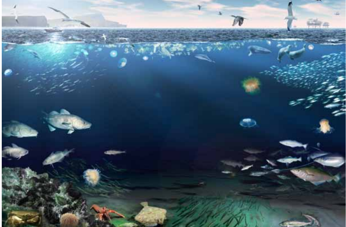
Illustrasjon: Arild Sæther

Fordi Nordsjøen er et grunt havområde, er prosessene på bunnen og oppe i vannmassene ofte nær koblet. Det bidrar til høy produktivitet. Som illustrasjonen viser er Nordsjøen også i stor grad påvirket av menneskelig aktivitet. Since the North Sea is shallow, the processes taking place on the sea bed and in higher waters often are closely linked. This contributes to a rich production. As shown in the illustration the North Sea is also strongly influenced by human activity.