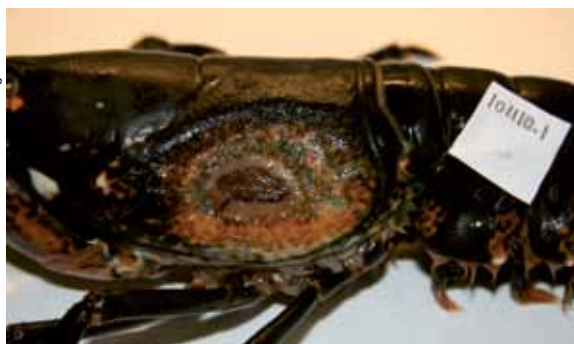
Figur 5. Europeisk hummer fanget høsten 2010 i Larvik-/Sandefjordsområdet, med unormal lesjon.

European lobster ( Homarus gammarus ) with damages considered normal (A, B), and fouling organisms attached to the lobster (C). A and B shows damages typically from claw encounters with other lobsters or crabs. Arrow in B points to an old wound.