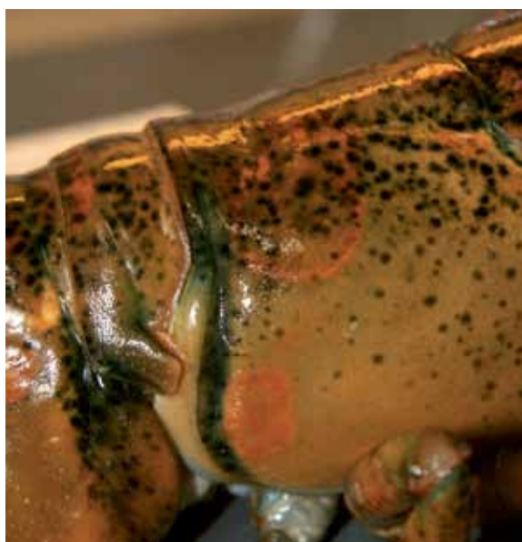
Figur 2. Amerikansk hummer med oransjefargede områder i skallet, trolig tidlige lesjoner.

Utvikling av skallsyke hos hummer er en gradvis og tidkrevende prosess. Det skiller mellom flere typer av sykdommen, karakterisert ved hvor lesjonene er, utseende