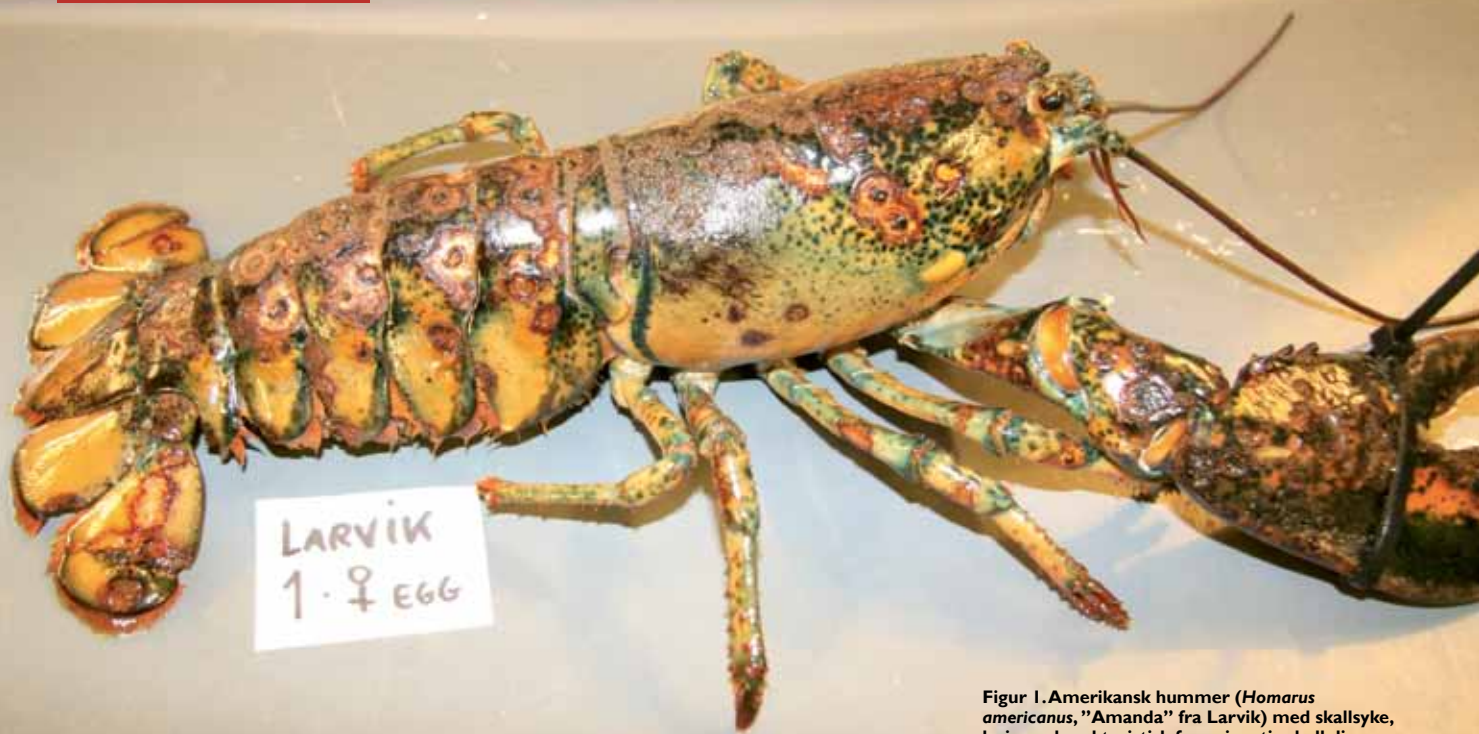
Figur 1. Amerikansk hummer ( Homarus americanus , "Amanda" fra Larvik) med skallsyke, lesjoner karakteristisk for epizootic shell disease (mai 2010).

American lobster ( Homarus americanus ) captured off south-eastern Norway with lesions characteristic for epizootic shell disease.