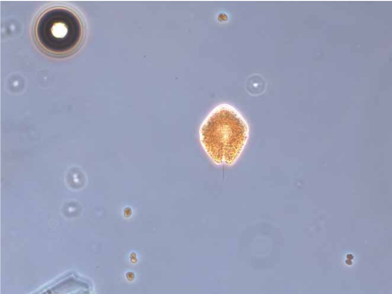
Figur 2. Akashiwo sanguineum

av februar og ut mars. 2010 var på flere måter et spesielt år, først og fremst gjennom vinter- og vårperioden. I januar og februar la isen seg langs kysten av Skagerrak, og oppblomstringen fant delvis sted under isen. Den startet allerede andre uken av januar, og i Flødevigen nådde den maksimum etter ca. en uke. Algebiomassen (Chl a ) er som oftest lav i forkant av oppblomstringer. Vinteren 2009/2010 avviker fra dette generelle mønsteret ved at det var relativt høy biomasse i desember 2009 og i begynnelsen av januar 2010, med betydelig algeproduksjon i vintermånedene. Fremtredende arter under våroppblomstringen var som vanlig Skeletonema costatum , Chaetoceros spp. og Thalassiosira nordenskiöldii . Det var forholdsvis mye av kiselalgen Pseudo-nitzschia spp. gjennom hele vinterperioden og under våroppblomstringen. Denne slekten var også relativt vanlig vinteren og våren 2009, mens den tidligere har vært mer knyttet til sensommer og høst. Våroppblomstringen etterfølges av en minimumsperiode. Dette var tilfellet også i 2010, men tidspunktet for minimumsperioden var helt uvanlig. Allerede fra begynnelsen av februar startet nedgangen i mengden av klorofyll a , noe som sammenfaller med en reduksjon i