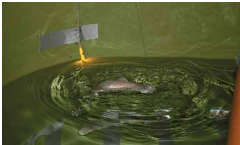
Figur 3. En torsk trekker i et plastagn som er koblet til en fôringsautomat, og fôr drypper ned i karet.

A cod pulls a plastic bait connected to a feeder, and food drops into the tank.