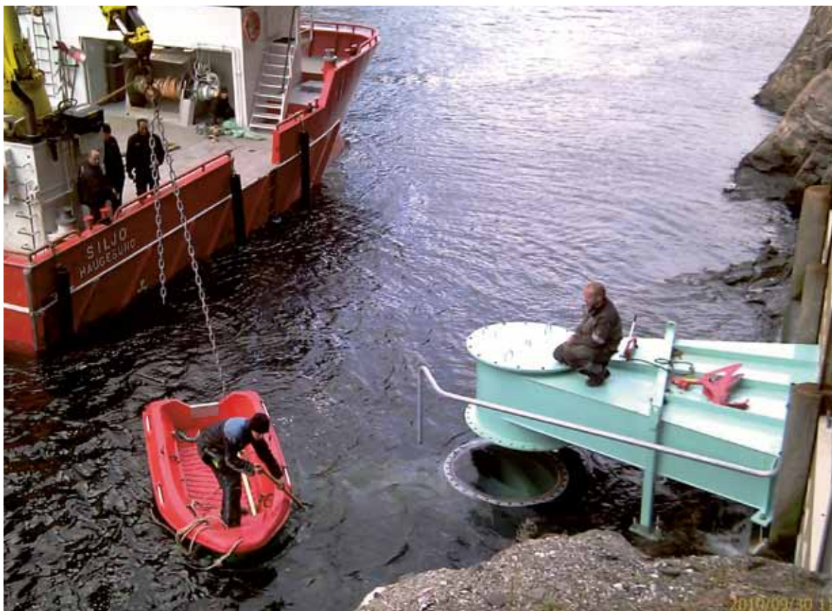
Montering av ny oppstrømningsstasjon i Lysefjorden. The new upwelling facility in Lysefjorden.

Anlegget i Lysefjorden er det første i sitt slag. Lysefjorden Forskningsstasjon AS har som mål å utvikle fasiliteten og dokumentere de kommersielle mulighetene som ligger i å bruke ferskvann til å løfte opp næringsrikt sjøvann fra dypet – til kultivering av marine planter og dyr. I samarbeid med Norges forskningsråd, Lysefjorden Forskningsstasjon AS, NIFES, Universitetet i Bergen og IFREMER (Frankrike) startet Havforskningsinstituttet i 2010 et prosjekt for å klarlegge hvordan økt mengde og endret sammensetning av planteplankton som følge av oppstrømningen påvirker vekst og frigivelse av alggifter hos dyrkede blåskjell. Det unike fjordlaboratoriet i Lysefjorden kan også gi viktig kunnskap om en rekke andre forhold ved økt planteplanktonproduksjon som påvirker økosystemet i fjorder.