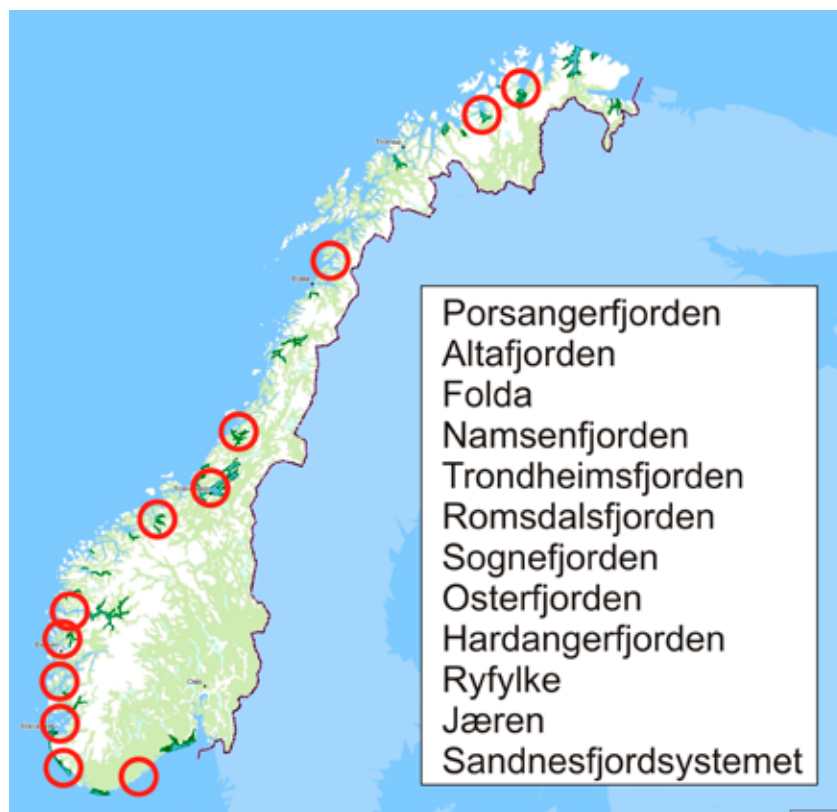
Figur 1. Områder (rød sirkel) som blir overvåket årlig med hensyn til lakselusmengde for å evaluere nasjonale laksefjorder (Kart fra Fiskeridirktoratet som viser nasjonale laksefjorder i mørkere grønt).

Havforskningsinstituttet og NINA vil fortsette å overvåke lakselusmengden langs norskekysten fremover til minst 2016. Det er nødvendig med en lang tidsserie slik at naturlige variasjoner kan avdekkes. Samtidig overvåkes relevante miljøforhold som strøm, saltholdighet og temperatur i vannmassene. Parallelt jobber vi med å modellere spredning av lakselus for å kunne tallfeste hvordan varierende miljøforhold virker på lakselus som en smittekilde for vill laksefisk.