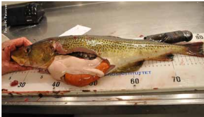
Figur 4. Tre år gammel torsk fra Varaldsøy i Hardangerfjorden. Torsken var førstegangsgyter med stor rogn, fin lever og høy filettvekt.

Hovedrekrutteringen til brisling kommer fra gytefelt i sentrale og sørøstre Nordsjøen og kystnære områder i Skagerrak. Det foregår også lokal gyting i de store vestlandsfjordene. EPIGRAPH har samlet genetisk materiale for å studere sammenhengen mellom brisling i Hardangerfjorden, lokal gyting og gyting utenfor fjorden. Vi har undersøkt brislingens mageinnhold for å sammenligne dietten med tilbudet av byttedyr i fjorden. Derfor har vi også studert planktonsamfunnet. De største dyreplanktonmengdene ble registrert ytterst i fjorden, og avtok innover i fjorden. Dette er karakteristisk for fjorder der ut- og innstrømning har stor innflytelse på dyreplanktonet. Store, næringsrike kopepoder som Calanus , forekommer i de ytre fjordområdene. De største registreringene av brisling ble imidlertid observert langt inne i fjorden og i fjordarmene der dyreplanktonmengdene var lave og dominert av små arter. Er dette fordi brislingen