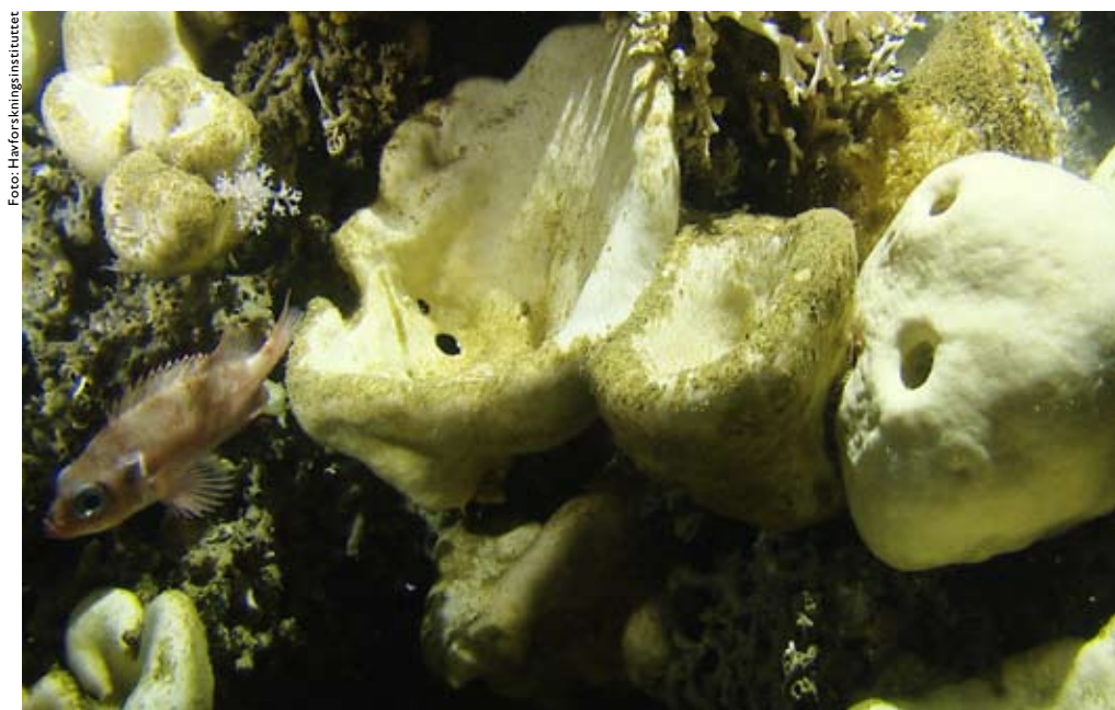
Eksempel på en Geodia -svamp man kan finne i svampområdene i Norskehavet. Lusureren ser man gjerne oppi de traktformede svampene.

I forbindelse med Havforskningsinstituttets korallundersøkelser og ved analyser av videoer fra oljeselskaper er det gjort mange observasjoner av hvordan fisk også er knyttet til svamper. Det er vanlig å se uer i områder med mye svamp. De ligger gjerne oppi de traktformede svampene eller på bunnen rett ved siden av svampene. Det er også vist at svampsamfunnene har en rik invertebratfauna. Det er derfor grunn til å anta at svampene har en viktig økologisk betydning både for fisk og mange invertebrater. Dette er imidlertid lite undersøkt.