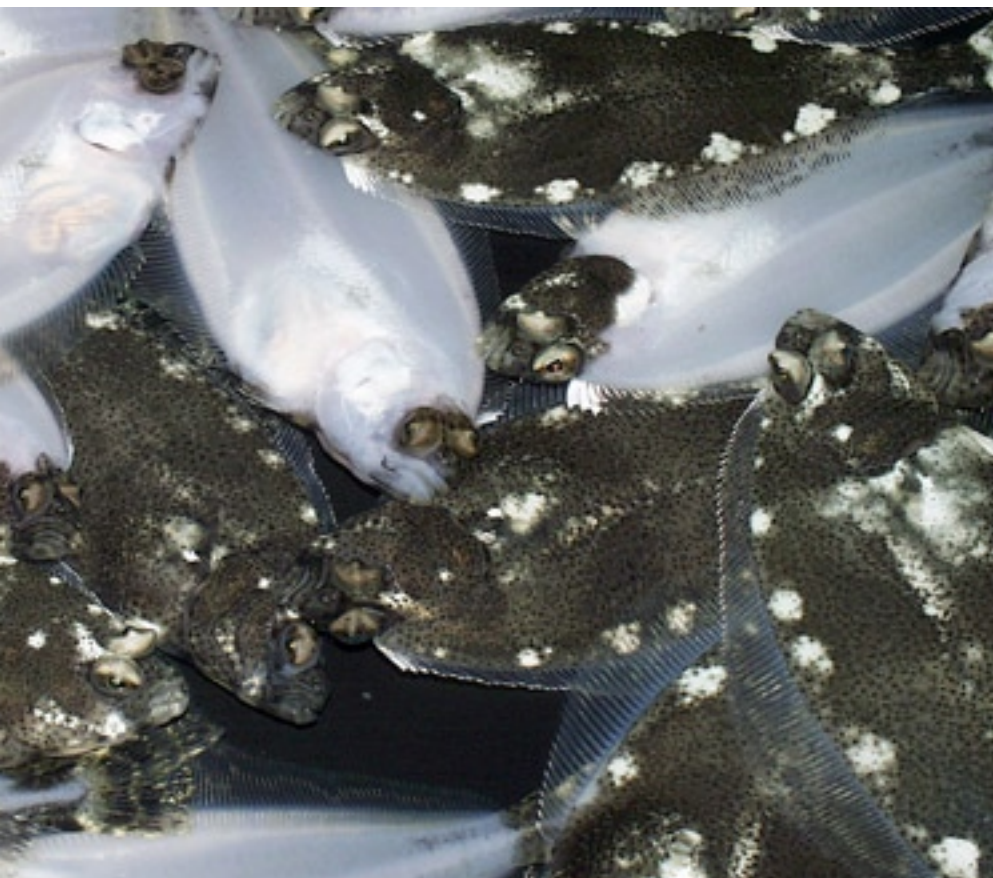
Figur 3.8.2 Kveiteyngel, både feilpigmentert og med ulik grad av øyevandring. Halibut fry of varying quality.

et lavere fettinnhold og større andel fosfolipider enn korttidsanrikt saltkrepss. Bruk av påvekst-Artemia viste seg å ha en signifikant effekt på øyevandringen. Disse funnene ble støttet opp av kjemiske analyser på kveitelarvene og saltkrepss gjennom forsøkene. En av de viktige konklusjonene fra disse undersøkelsene var at økt innhold av protein og mindre fett i påvekst-Artemia samt høyere nivå av jod i larver føret på påvekst-Artemia ser ut til å være medvirkende til bedre øyevandring. Man fant også bedre tilgjengelighet av næringsstoffer fra påvekst-Artemia på grunn av bedre fordøyelighet.