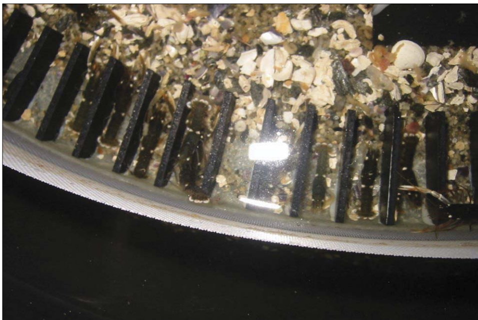
Figur 6.4.4 Hummer yngel på innsiden av Lobster Settling System™. Lobster juveniles inside the Lobster Settling System™.

praktisk erfaring samt kunnskap om hummerens atferd ved utsett i sjøen. I tillegg til teknologi og tidspunkt for utsetting, har hummeratferd versus værmessige forhold gjennom døgnet (dag/natt/flo/fjære) vært viktige parametere å evaluere.