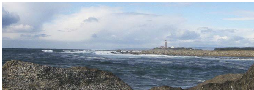
Figur 6.4.1 Havbruk på Lista og i Farsund. Sea farming at Lista and in Farsund.

Den norske hummeren regnes for å være verdens beste. Allerede på 1600-tallet var norsk hummer en ettertraktet vare. Innfanget hummer ble kjøpt opp av utenlandske kjøpmenn langs hele kysten. Reguleringer ble forsøkt innført uten særlig hell. Fra midten på 1960-tallet gikk bestanden markert tilbake, og de registrerte fangster utgjør i dag bare ca. 5 %, dvs. ca. 50 tonn per år. Hovedårsaken til dette er en feilslått forvaltning. Det er igangsatt bestandsøkning/utsettingsforsøk og også vedtatt en ny lov om havbeite. Loven ble vedtatt i desember 2000, og de første tillatelsene ble tildelt i årsskiftet 2004/2005. Hummerhavbeiteselskapet Aegir Havbruk har siden 2001 jobbet med å utvikle utstyr og metoder for å etablere en lønnsom hummernæring basert på den nye havbeiteloven.