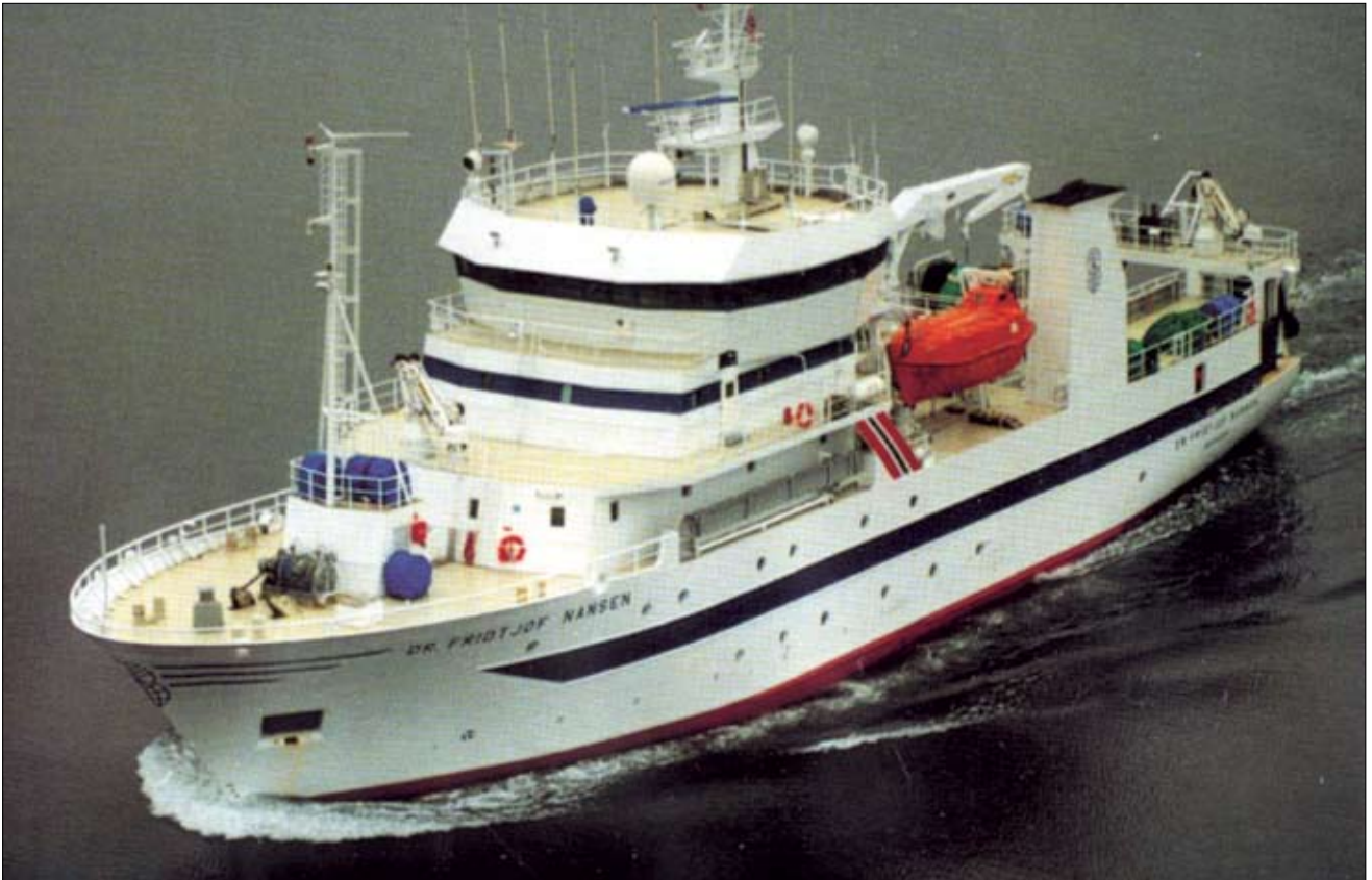
”Dr. Fridtjof Nansen” har vært et viktig redskap for ressurskartleggingen i sør.

har namibierne gradvis overtatt ledelsen i prosjektene, i første omgang med fortsatt bruk av norske tekniske ressurserslik som f.eks. ”Dr. Fridtjof Nansen”, men senere med fullt ut egenfinansiert infrastruktur. Det direkte bilaterale faglige samarbeidet med Norge kom til avslutning i 2005, men personell fra Havforskningsinstituttet og Fiskeridirektoratet vil fortsatt bistå med faglige råd.