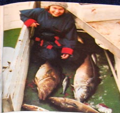
När torsk og sej i den här kalibern drar på pirkar-na på bara 30 meters djup får en havsfiskare snabbt mjølksyra i armarna. Det finns gott om kampfællig havsfisk længs Norges kust.