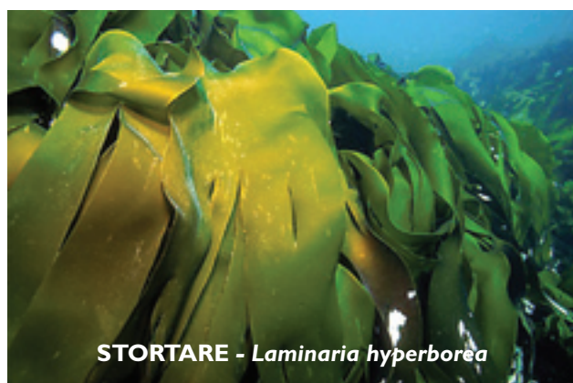
STORTARE - Laminaria hyperborea

Bremangerpollen er delt inn i to tarefelt som omfatter henholdsvis den nordlige og den sørlige siden. På nordsiden