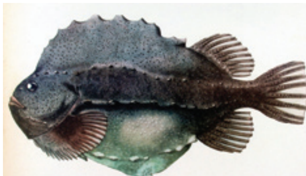
ROGNKJEKS - Cyclopterus lumpus

Tabell 5.3.1, som viser utviklingen av fangstmengde, gir ikke et bilde av utviklingen i bestanden. Til dette trengs det også