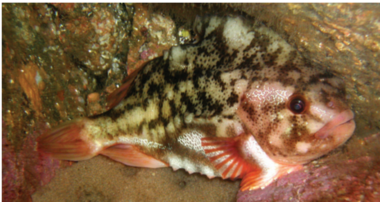
ROGNKJEKS - Cyclopterus lumpus

Figur 5.3.1 viser den modellerte bestand fra 1988 og fremover gitt som potensiell rognmengde, sammen med årlige totalfangster siden 1988. Fangstene lå før det lenge rundt 300-400 tonn, og dette nivået er derfor også antatt å være bærekraftig. I perioden 1987-1997 var fangstene de fleste år