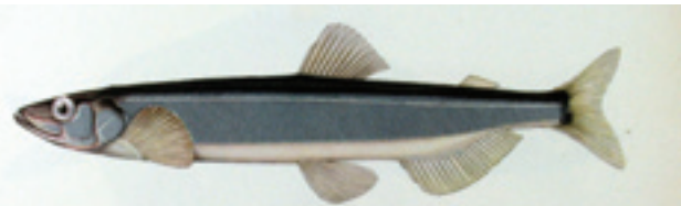
LODDE - Mallotus villosus

Yngeltokta i 2003 viste ei halvering i mengda av larvar samanlikna med 2002, til same nivået som i 2001, men langt lågare enn i perioden 1998-2000. Larveproduksjonen