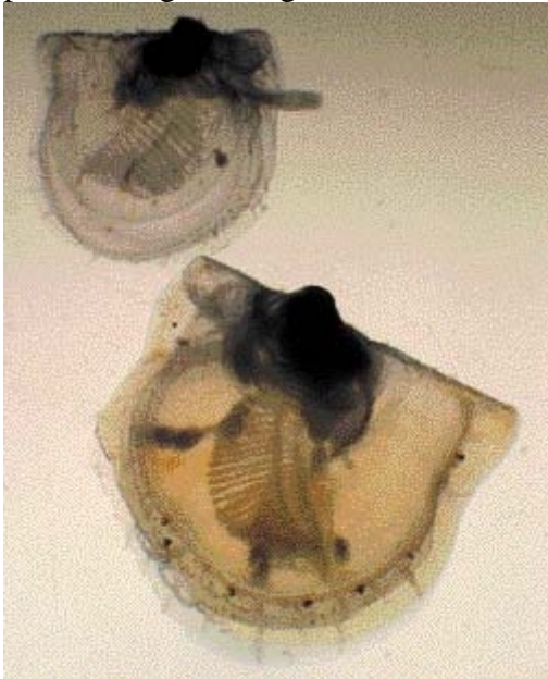
Figur 3 Yngel med fot og øyeflekker. Skallbredden er 1 og 2 mm.

produksjonslinjen viser en økning fra 3 mill. kr i klekkeri til 30 mill. kr etter sluttkulturen. Dette er verdier ut fra produsent, og må ikke sammenlignes med priser på Fisketorget i Bergen, der totalverdien ville vært 120 mill. kr.