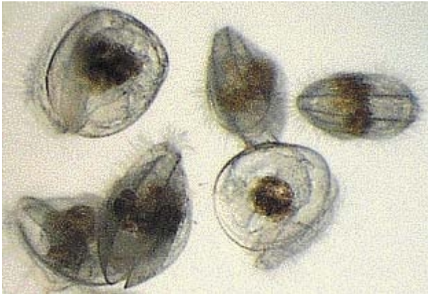
Figur 4 Svømmende larver med et ciliert velum (høste-apparat for fôrpartikler).

Når disse målene er nådd, er det virkelig skapt et grunnlag for storskala produksjon og omsetning i et internasjonalt marked.