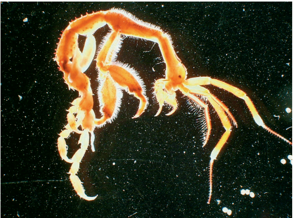
Figur 7. Asiatisk spøkelsekreps Caprella mutica , først påvist i Norge 1999, og nå svært vanlig på tau og fiskemerder som står i sjøen på Vestlandet.

I henhold til Konvensjonen om biologisk mangfold («Rio-konvensjonen»), som Norge ratifiserte i 1992 (St. Prp. nr. 56 1992-93), skal