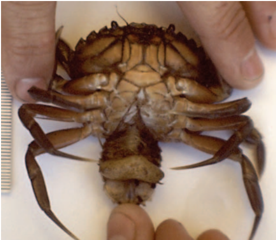
Figur 6. Strandkrabbe parasitert av kopepoden Sacculina carcini.

organismer er også en fare. Krepssdyr kan selv opptre som parasitter, for eksempel kopepoder som opptre som gjellemark hos fisk. Noen arter er i sine hjemland mellomvert for parasitter som går på mennesker. Ullhånds-krabben som har etablert seg i USA blir løpende overvåket for å kunne oppdage om noen av dem bærer med seg den orientalske lungeikten Paragonimus westermanii , som arten er kjent for å spre i sine hjemmelige områder i Asia.