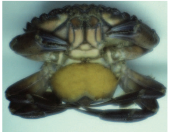
Figur 3. Strandkrabbe med utrogn.

Noen arter har stor tørketoleranse og klarer seg til og med godt på land og kan oppholde seg ute av vannet i dagevis, så