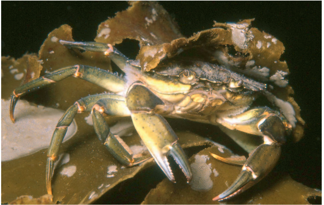
Figur 2. Den europeiske strandkrabbe Carcinus maenas , er nå påvist fra Patagonia til Canada, så vel som Asustralia og New Zealand.

under overvåking. Av disse er fem storkrepsarter (Malacostraca), to rurarter (Cirripedia) og en tanglusart (Amphipoda).