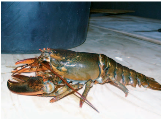
Figur 5. Amerikansk hummer Homarus americanus fanget utenfor Ålesund 2003 (Foto: Astrid Woll).

Menneskeskapte konstruksjoner er en tredje faktor som har vist seg å føre til forandringer som er til gagn eller direkte fører til etablering av nye krepsdyrarter. Dammer som stanser eller endrer elvestrømmer, kunstige sjøer, kanaler mellom tidligere atskilte elveløp og også mellom verdenshav åpner opp nye utvekslingsveier og vil endre økosystemene. Krepsdyr har visst å utnytte dette.