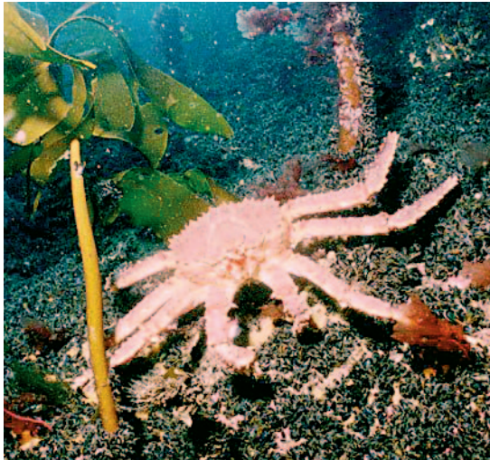
Figur 4. Kongekrabbe Paralithodes camtschatica fotografert i Varangerfjorden 2002.

funnet i norske farvann har hatt en typisk «markedsstørrelse», og er med all sannsynlighet oftest importert for konsum.