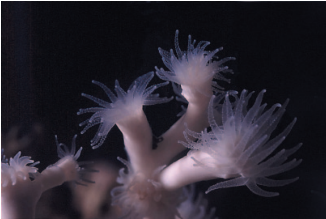
Figur 6.20 Skjelett og polypper av Lophelia pertusa fotografert i akvarium. Skeleton and polyps of Lophelia pertusa photographed in aquarium.

ser ut til å ligge på rundt 6 mm pr år. Med denne voksehastigheten vil en 2 m høy koloni være rundt 300 år gammel.