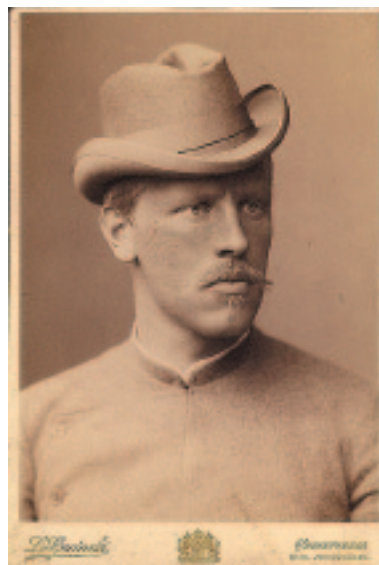
Figur 6.9 Fridtjof Nansen (1861–1930). En genial generalist.

Datidens største sprang fremover for norsk havforskning var sannsynligvis Den norske Nordhavsekspedisjonen 1876–78 med Henrik Mohn og Georg Ossian Sars som initiativtakere. Dette var en serie av tre tokt med “D/S Vøringen”. Disse toktene representerte starten på norsk havgående marin forskning. Opparbeidelsen av materialet fra disse toktene ble hovedsakelig gjort av medarbeidere ved Bergen Museum. Her arbeidet Nansen som konservator i tiden 1882–87, og alle Nansens kolleger