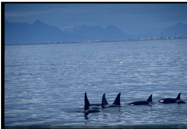
Figur 2. Spekkhoggerne er noen kraftige sluggere på flere tonn. De er lett gjenkjennelig med sin store svarte ryggfinne som kan bli 1.5 meter høy hos voksne hanner, den grå sadelen bak ryggfinnen og de kontrastfulle hvite partiene framme og på undersiden av dyret. I bakgrunnen skimtes Andøya fyr på Andenes i Nord-Norge.

Silda lever i store stimer som kan telle flere millioner individer. Hovedårsaken til denne adferden er å beskytte seg mot farlige fiender som spekkhoggere, vågehval, torsk, sei, og forskjellige typer sjøfugl som havsule og havørn, for å nevne noen. Silda lever et ytterst farlig liv. Spekkhoggeren er derimot kongen på berget eller rettere sagt i havet ( Figur 2 ). Den har ingen naturlige fiender (unntatt mennesket) og blir derfor kalt topp-predator.