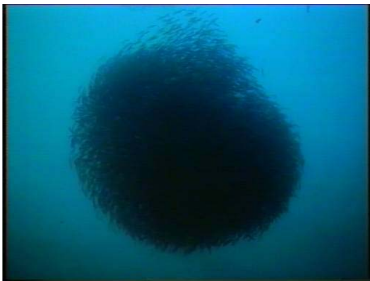
Figur 4. Silda svømmer i sirkel innenfor et begrenset område i en tett ball ved overflaten. Merk at bildet er tatt fra undersiden av stimen og vi ser opp mot overflaten. Slike situasjoner er tegn på at silda er i trøbbel og spekkhoggerne angriper villig med sporen når de har tvunget silda opp til overflaten og pakket dem godt sammen slik som vi ser her på bildet.