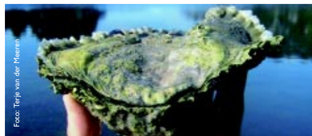
Figur 5 Vill flatøsters (670 gram) fra Austevoll med stor vekstsone fra den varme sommeren 2002. Wild flat oyster (670 gram) from Austevoll with large growth sone, summer 2002.

Siden sommeren 2000 er det gjennomført prøvedyrking for matskjell på 20 lokaliteter i Sunnhordland. Resultater i 2002 indikerer at det i denne regionen kan dyrkes frem konsumøsters (60 gram levende vekt) på fire år, og ned i tre år i pollene. Prøvedyrkingen har vist hvor viktig det er med høye temperaturer i sommer- og høstsesongen for god vekst hos flatøsters (Figur 5). Dersom det kan etableres kostnadseffektive dyrkingsmetoder i stor skala hvor man oppnår denne veksten, vil dette styrke muligheten for å kunne utvikle en større norsk østersnæring.