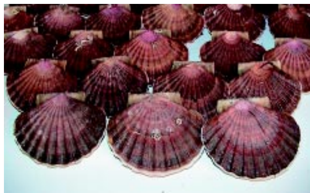
Figur 4 Stort kamskjell dyrket i inngjerdet havbeite. Great scallop grown in fenced bottom cultures.

Hos flere næringsaktører blir det nå utprøvd ulike typer inngjerding for å hindre tilkomst av taskekrabbe til kamskjell i bunnkultur (Figur 4). Helland kamskjelloppdrett ANS har utviklet en gjerdeløsning som er dokumentert å være effektiv. Utsett av 18 000 kamskjell (50 mm skallhøyde) i oktober 2000 viser en overlevelse på 89 % etter 26 måneder. Skjell fra dette utsettet vil være høstingsklare i 2003, fire år etter klekking. Bruken av gjerdet i havbeite med kamskjell er vurdert som meget lovende for å øke lønnsomheten i produksjonen. Med utgangspunkt i at gjerdet på bunn effektivt hindrer taskekrabbens tilkomst til skjellene, er målsettingen nå å videreutvikle metodene for å korte ned eller å unngå den tradisjonelle mellomkulturfasen i nett eller kasser. Innledende forsøk utført i samarbeid mellom Havforskningsinstituttet og Helland kamskjelloppdrett ANS har vist at yngel plassert direkte på bunn vokser hurtigere enn yngel i mellomkultur. Liten yngel som settes direkte ut på bunn synes imidlertid å være utsatt for predasjon fra berggylt. Det er derfor nødvendig å klarlegge hvilke kamskjellstørrelser berggylten spiser. Økt kunnskap om