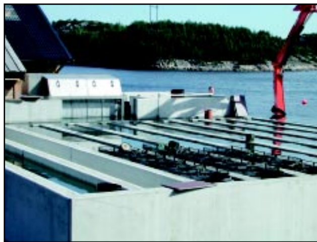
Figur 2 Det nye landanlegget for kamskjellyngel hos Scalpro AS på Rong i Øygarden. The new land-based on-growth facility for scallop spat at Scalpro AS at Rong in Øygarden.

(4000 liter) beregnet for kontinuerlig gjennomstrømming. I 2002 ble en større andel av larvene satt direkte på yngelsamlere i forhold til normalt system med kasser og finmasket duk. Samlerne ble overført til sjø, og yngelen sortert etter seks uker. Kasser med finmasket duk har vært satt direkte i landanlegget (Figur 2), der grovfiltrert (100 µm) sjøvann tilføres. Vekst og overlevelse i 2002 har vært god både i landanlegg og i sjø, og totalt ble 600 000 yngel levert til 12 dyrkere på Vestlandet.