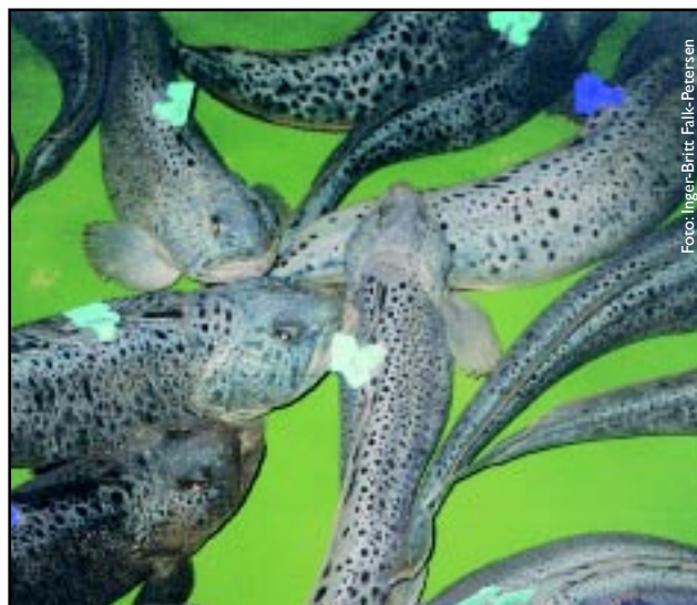
Figur 2 Stamfisk av flekksteinbit. Spotted wolffish brood stock.

En forutsetning for vellykket yngelproduksjon er en god stamfiskbestand. Steinbit har vært oppbevart i relativt grunne lengdestrømsrenner under høye tettheter og har ikke vist aggresjon eller tendenser til å være stresset (Figur 2). De er blitt føret med kveitefôr. Det er viktig at føret er flytende i