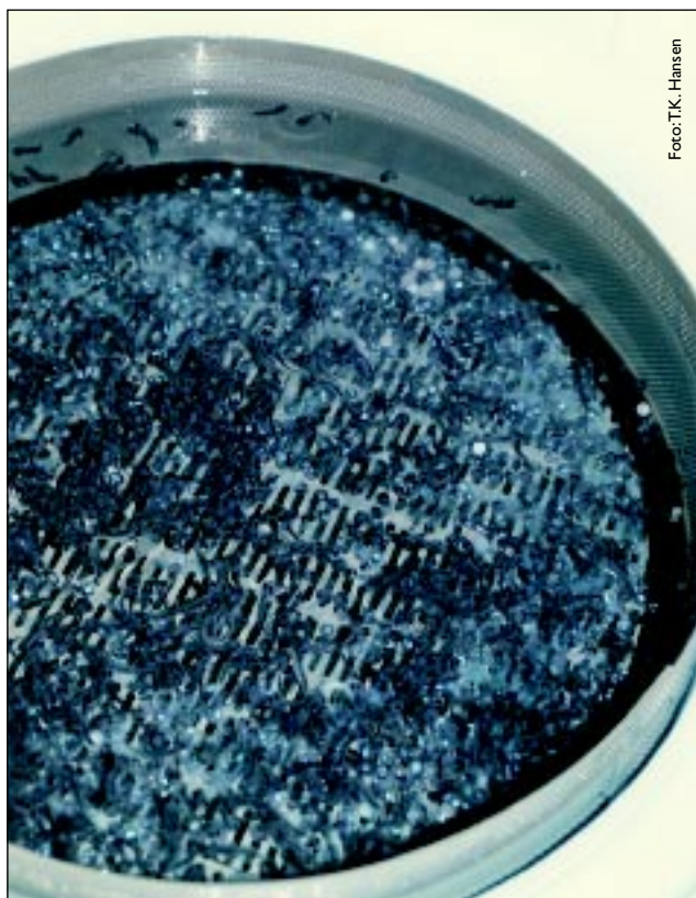
Figur 3 Steinbitlarver som klekkes i inkubator. Hatching wolffish larvae in incubator.

Fra 100 grams størrelse vokser flekksteinbiten godt ved lave vanntemperaturer. Ved en snitttemperatur på 5,2 °C har fisken nådd en slaktevekt på 4,5 kg etter tre år fra