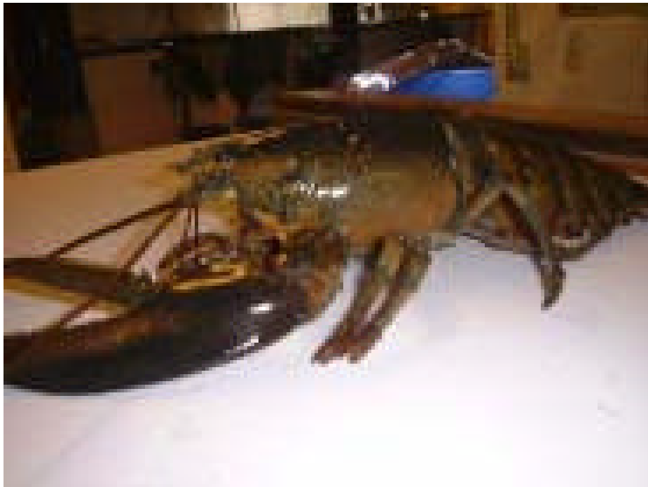
Figur 5.32 Amerikansk hummer ( Homarus americanus ) fanget i Oslofjorden 1999. American lobster (Homarus americanus) captured in Oslofjorden 1999.

En rekke trekk ved form, vekt og farge bekreftet at det virkelig var en amerikansk hummer, H. americanus , det første frittgående eksemplar som noen gang har vært fanget i Norge. Individet var en hunn på 24 cm, og følgelig for liten til å være en av de opprinnelig utsatte hummerne. Like etter kom det inn en ny, avvikende hummer, denne gangen en eggbærende hunn (figur 5.32).