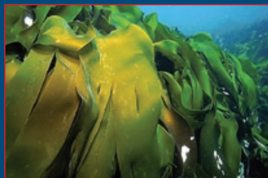
STORTARE - Laminaria hyperborea

Stortaren høstes etter en syklus på fem år, noe som betyr at taren i gjennomsnitt får 4,5 år til gjenvekst før den igjen blir