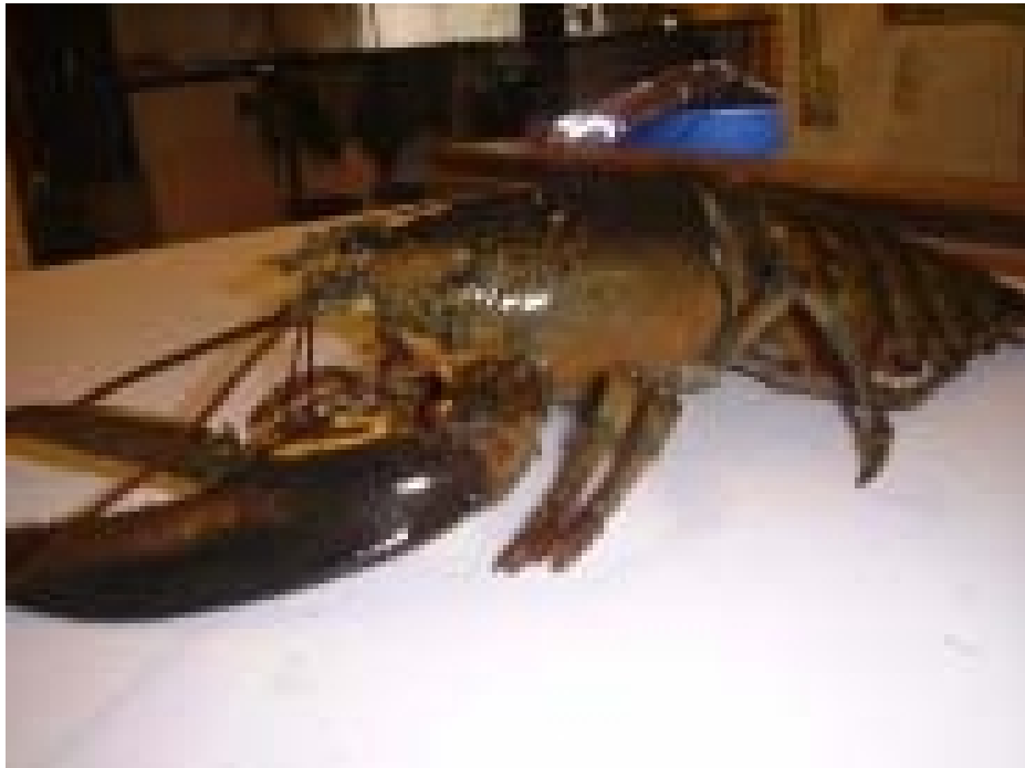
Figur 5.32 Amerikansk hummer ( Homarus americanus ) fanget i Oslofjorden 1999. American lobster (Homarus americanus) captured in Oslofjorden 1999.

En rekke trekk ved form, vekt og farge bekreftet at det virkelig var en amerikansk hummer, H. americanus , det første frittgående eksemplar som noen gang har vært fanget i Norge. Individet var en hunn på 24 cm, og følgelig for liten til å være en av de opprinnelig utsatte hummerne. Like etter kom det inn en ny, avvikende hummer, denne